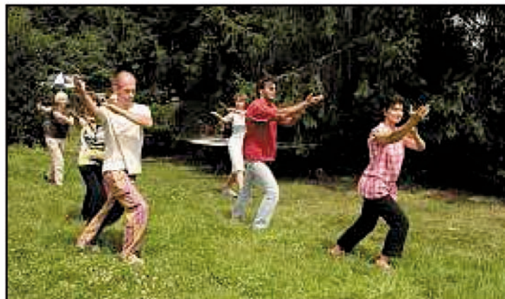
En tai chi chuan, les stagiaires ont fait leurs premiers mouvements en plein air.